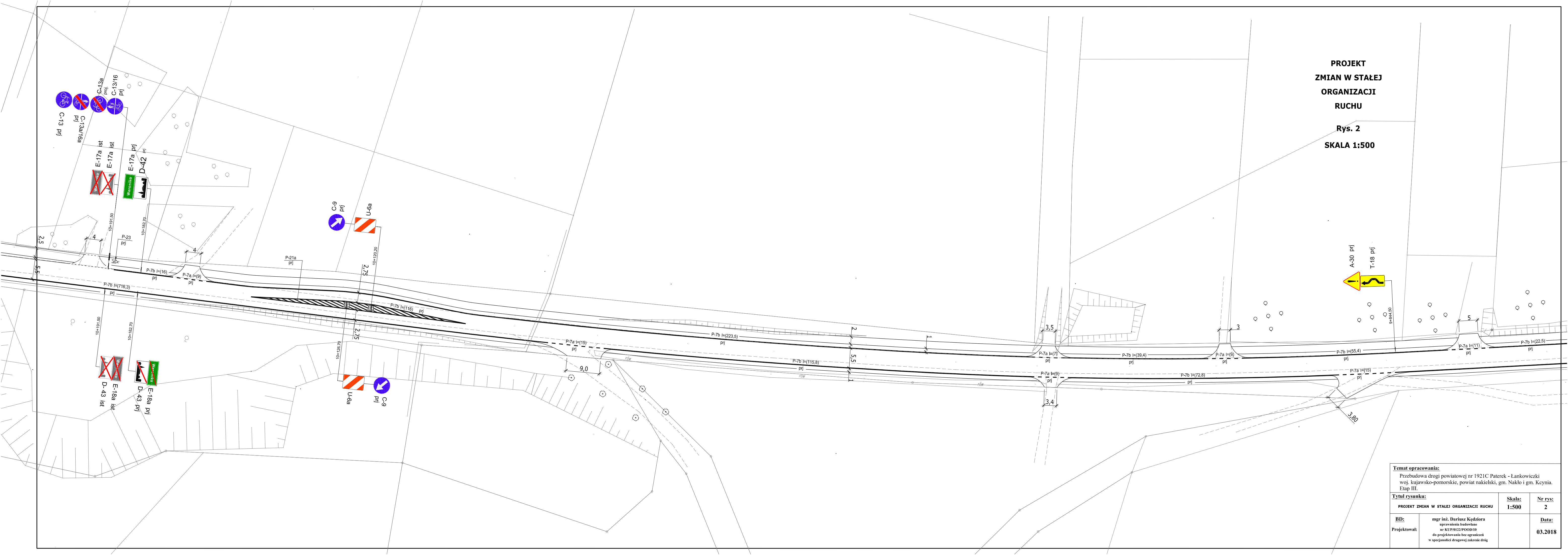
Rys. 2 SKALA 1:500